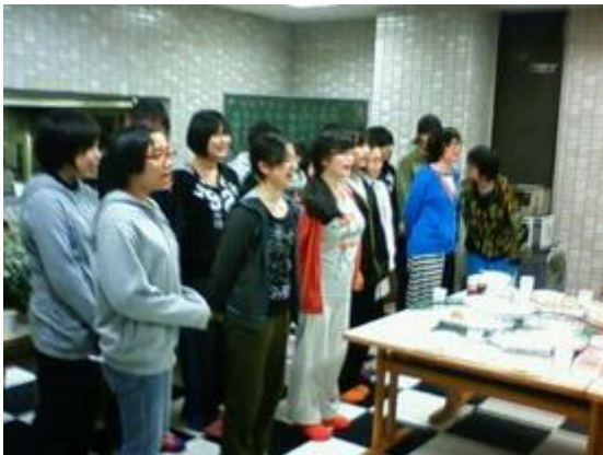
こちらは在寮生たち！