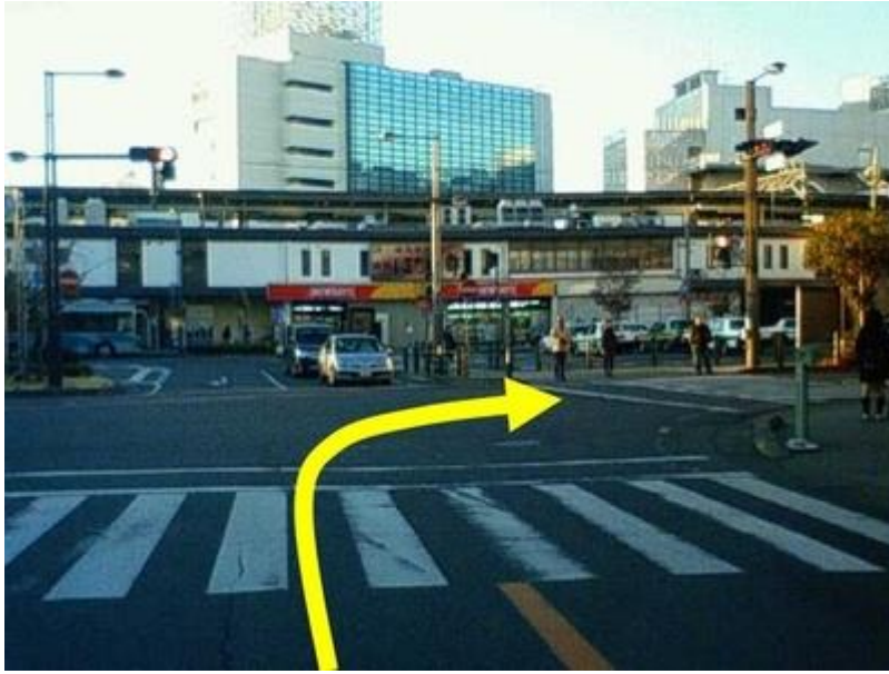
取手駅東口交差点の右折。