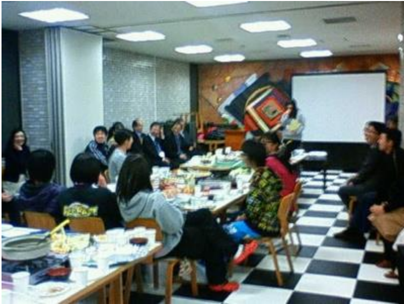
高三の卒業生たち, 6名。