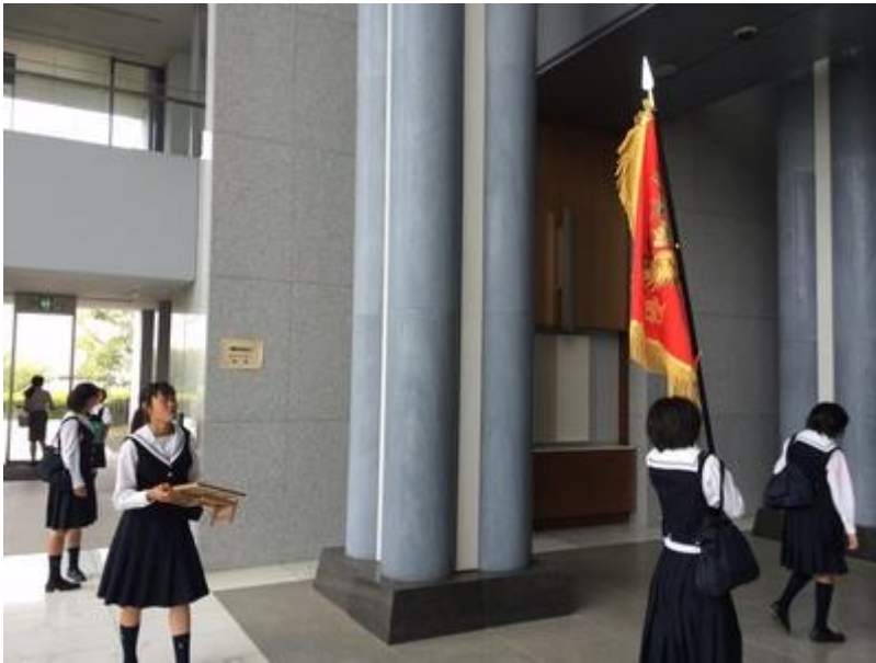
優勝旗について、庁舎内。